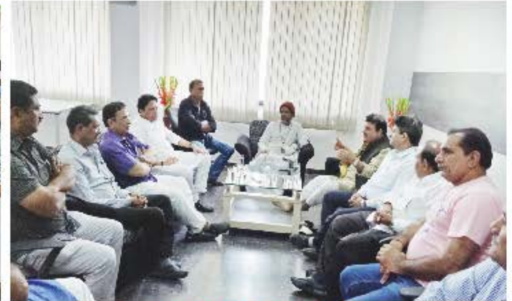
તા. ૮ સપ્ટેમ્બર ૨૦૧૭ - સિદ્ધપુર