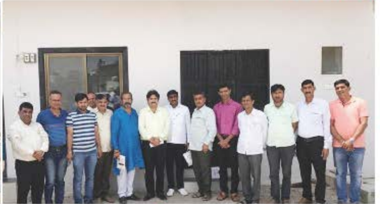
તા. ૧૫ ઓગસ્ટ ૨૦૧૭ - પાટણ