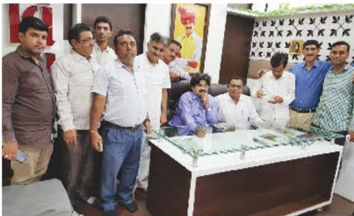
તા. ૩ સપ્ટેમ્બર ૨૦૧૭ - પાટણ