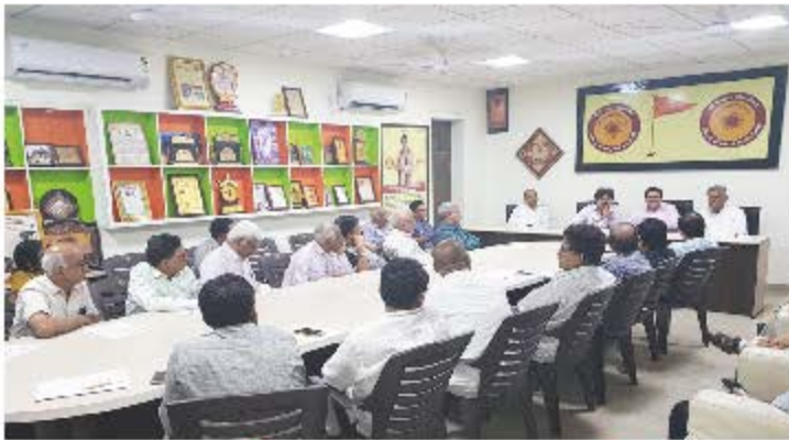
તા. ૪ સપ્ટેમ્બર ૨૦૧૭ - મહાનગર કાર્યાલય